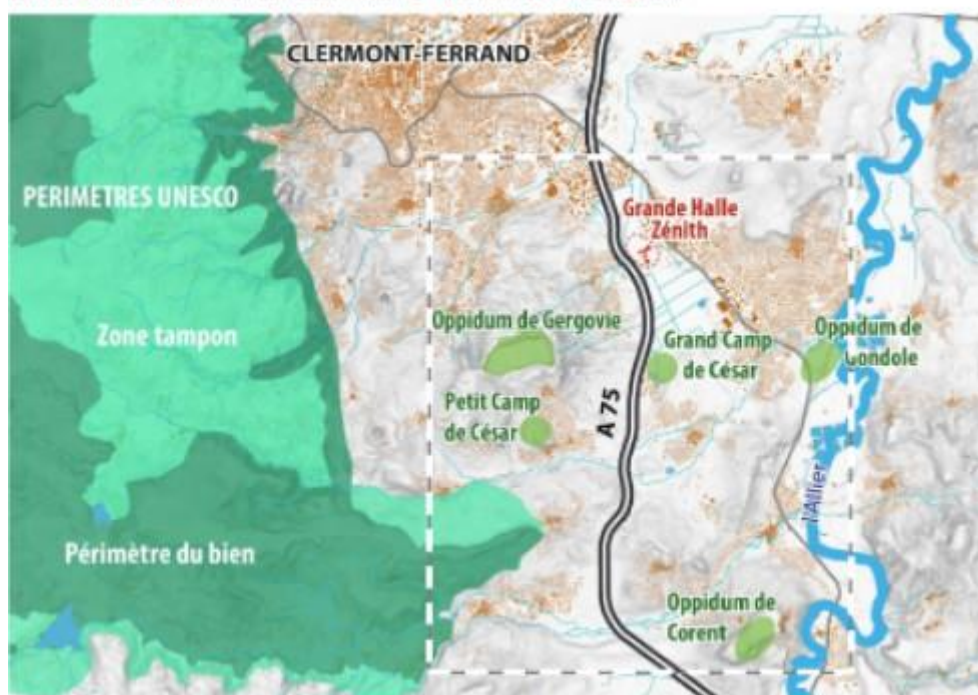
Entrée Sud de l'agglomération clermontoise - Périmètre d'investigation

Le plateau de Gergovie se pose en pièce maîtresse de ce territoire contrasté, aux enjeux parfois contradictoires. Le périmètre de réflexion concerne 17 communes situées sur Mond'Arverne Communauté et Clermont Auvergne Métropole.